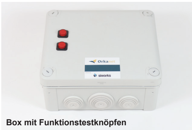
Box mit Funktionstestknöpfen

Die montagefertige Box mit Funktionstestknöpfen. Die Box ist je nach Art des Kontakts (Potenzialfrei oder 230V) entsprechend ausgelegt. Dazu erhalten Sie das für Ihre Anwendung passende LoRa-Modul. Das DI-200 für Störkontakte, das AI-200 für Sensormesswerte oder das DO-200 für die Geräte-Fernsteuerung.